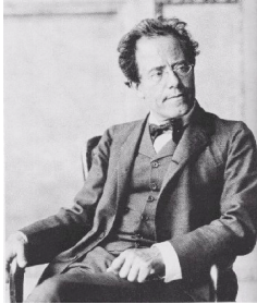
グスタフ・マーラー Gustav Mahler (1860~1911)

カバはカバでしかいきられない、しかし、人間は変わることができる (Becoming)