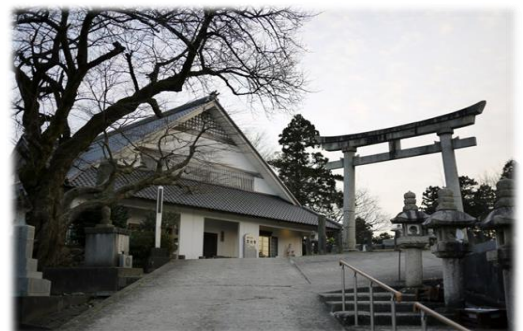
神道と仏教の融合・バランス